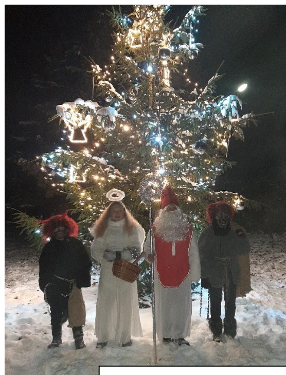
Mikuláš v obci 5.12.2023

Ze sportu se lze bohužel zmínit jen o naší fotbalové přípravce, která měla několik turnajů a neumístila se špatně. Baník Mořina měl tradiční turnaj v malé kopané a to bylo vše. Mořinský fotbal nám tady chybí.